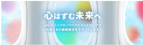
※サイトトップイメージ

「 JALソリューション・サービスサイト 」では、自治体や、企業・学校などの法人のお客様が抱える多様な課題・ニーズの解決に向けて、JALグループのさまざまな商品・サービスをご案内しております。